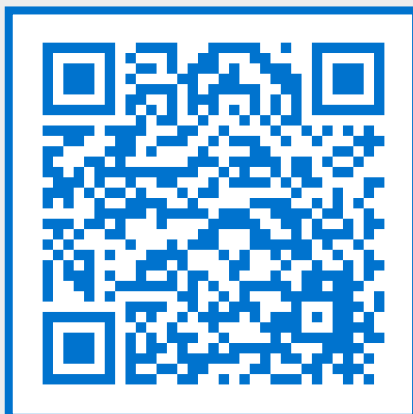
Plan Local de Acción Climática