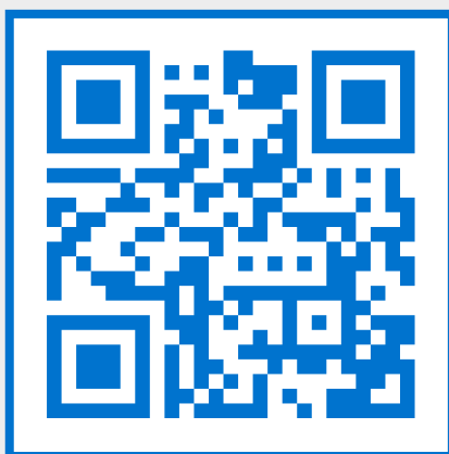
Estrategia de Género y CC